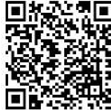
Cykl "Lider Radzi"