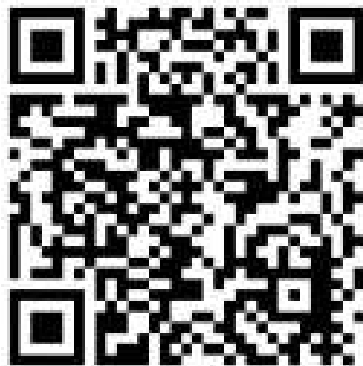
Cykl "Szlachetne zdrowie"